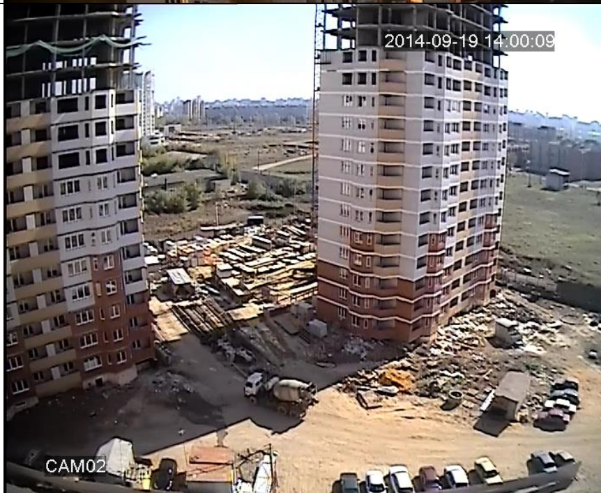
Корпус 40Б. Монтаж 18 этажа (завершение). Кирпичная кладка 13 этажа. Кладка перегородок 2-5, 13 этажей. Электротехнические работы 1-5 этажей. Штукатурные работы 4-5 этажей. Монтаж ИТП в техподполье. Заделка швов плит перекрытий, окраска 1-13 этажей. Монтаж окон 11 этажа.